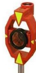
призма перед осью вехи