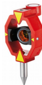
призма за осью вехи