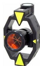
призма перед осью вехи